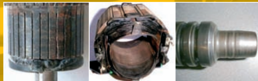
Степени накрайници - от претоварване

Примерите по-долу не се покрива от гаранцията: