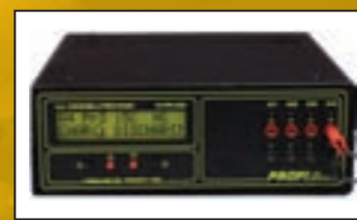
Пегас (Pegasus) тестер за батерии

Моля, свържете се с местния Сервизен Мениджър служба за повече подробности.