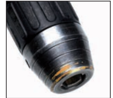
Износване, причинено при работа на свредлото с патронника върху зидария или други твърди повърхности