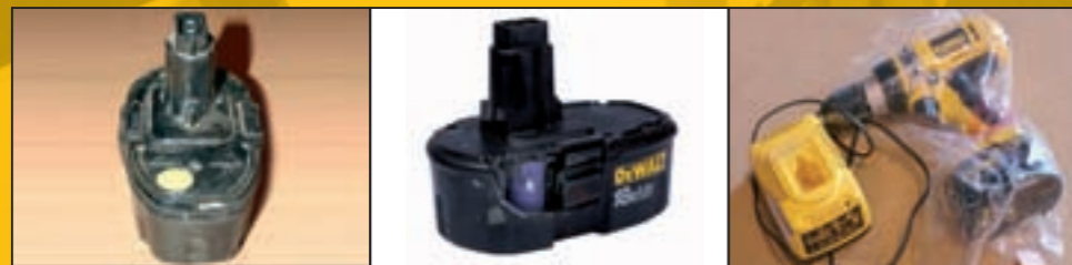
Потребителят се е опитвал да отваря батерия

Когато стане ясно, че тези указания не са били следвани, каквато и да е повреда на батерията или ниска производителност не се покрива от гаранцията.